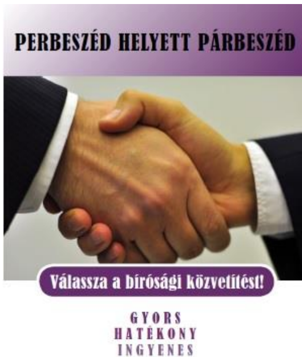
1. sz. kép, bírósági közvetítés plakát, „Perbeszéd helyett párbeszéd” (OBH)

Spem longam resecens” „CARPE DIEM, quam minimum credula postero” 4 útmutatására figyelemmel ennek prognosztizálása nem követelmény jelen dolgozatban, a „létező világok legjobbjában” „Travaillons ... c' est le seul moyen de rendre la vie supportable ... il faut cultiver notre jardin” 5 : megtalálva a jelen és jövő abszurdításában a valóság hagyományos szegmenseit.