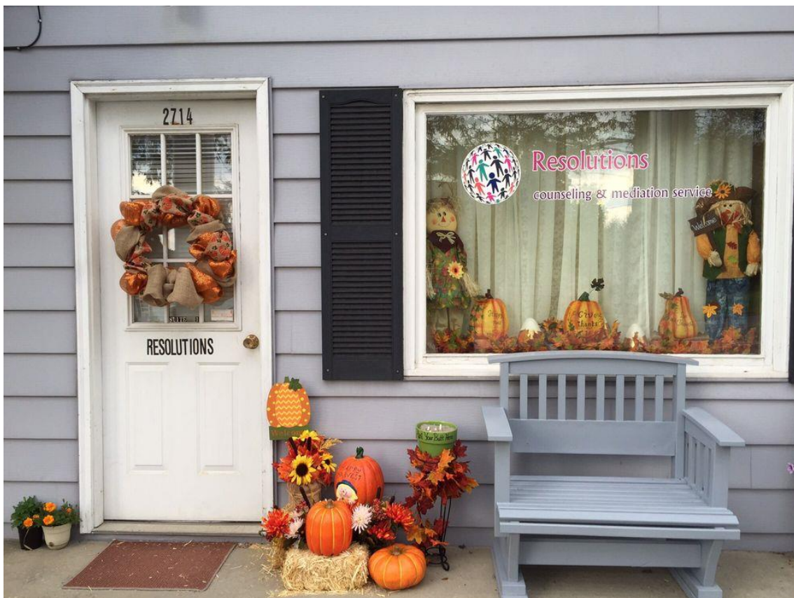
3. sz. kép, amerikai kisvárosi mediátor iroda 44

határon átnyúló szolgáltatásnyújtás keretében kívánják folytatni.” 41 Miután azonban itt csak névre lehet keresni, tényleges használati értéke csekély, névtöredék és más próbákat követően sem sikerült egyetlen érvényes találatot kinyerni. Valójában itt más EGT tagállamban letelepedett, de Magyarországon is szolgáltatást nyújtani kívánó közvetítőkről van szó 42 , pedig hasznos volna - egyebek pl. diploma, munkatapasztalat mellett - egyre inkább globalizálódó kapcsolatrendszerek körében hazai mediátorok illetően kompetenciájának láttatása is, a pusztán „nyelvismeret” feltüntetése semmitmondó, különösen annak szintje, vállalási hajlandóság megjelenítése hiányában (már csak amiatt is kritizálható, mivel a bejelentési úrlapon van kérdés a nyelvismeret fokáról, diplomáról, adat rendelkezésre állna). A bírósági közvetítők nyilvántartása az OBH honlapján érhető el 43 . Egy barátságos benyomást keltő amerikai kisvárosi mediátor irodát a 3. sz. kép illusztrál. (A kisszámú hazai irodák egyikének fényképe akár egy nem szándékolt példaállítást, elköteleződést vagy reklámot sugallhatna).